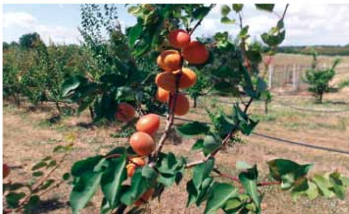
▲ Particolare della produzione di Tsunami** (EA 5016 cov) , auto-incompatibile, interessante per l'epoca di maturazione.