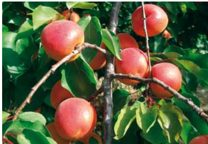
▲ Kioto* , auto-compatibile, ad elevato fabbisogno in freddo, con frutti con caratteri moderni.

una forte diminuzione di questi tempi di valutazione con rischi oggettivi di insuccessi produttivi. Molte delle nuove introduzioni sono auto-incompatibili, per cui si rende indispensabile l'abbinamento di adeguati impollinatori, che variano rispetto alle diverse zone.