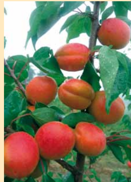
▲ Pricia (sin.) e Mediabel, due belle albicocche precoci della serie Carmingo ®.

maturazione molto precoce. Infine, per quanto attiene il ciliegio, dal 1962 IPS ha la licenza Europea per le varietà ottenute dal Centro di ricerca di Summerland (Canada); i genotipi selezionati hanno calibro importante, buona consistenza e, soprattutto, sono quasi tutti auto-fertili. Fra le varietà più significative figurano Skeena ®, Satin ®, Samba ® e Sweetheart ® che hanno fatto registrare un notevole sviluppo in Europa negli ultimi anni.