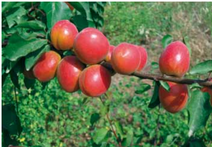
▲ Particolare delle produzioni di Orange Rubis®Couloumine* , la varietà più impiantata negli ultimi 5 anni nel Sud Italia.