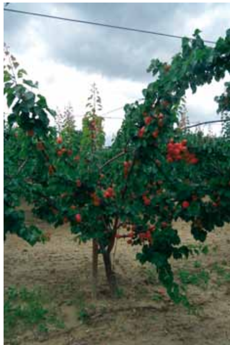
▲ Pianta di Primus*, interessante per la precocità di maturazione.

Sarebbe auspicabile che gli organi preposti delimitassero il territorio, laddove sia ancora possibile, per definire areali indenni dalle infezioni in cui si potrà pianificare l'esecuzione di nuovi campi di drupacee con sufficienti garanzie di medio-lungo periodo. ■