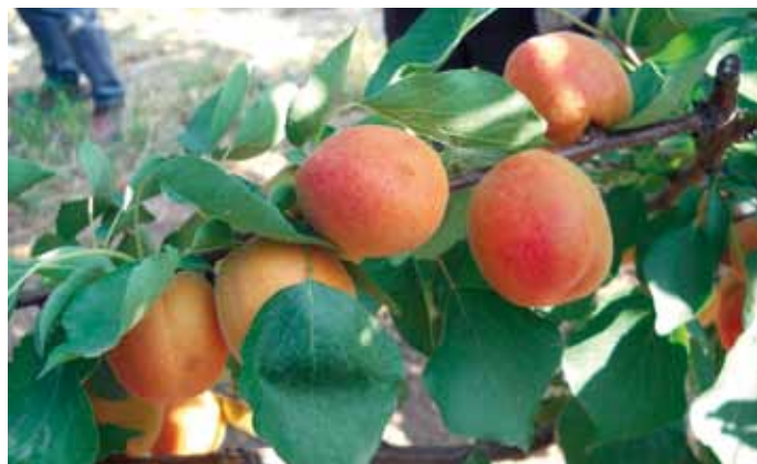
▲ Particolare della produzione di Flopria* , varietà autofertile e a basso fabbisogno in freddo.