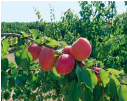
▲ Particolare della fruttificazione di Faralia.

resta da verificare l'adattabilità ai diversi ambienti di coltivazione. Rubistà* , autofertile, presenta frutti molto colorati, con colore che tende al viola, molto dolci; ancora da confermare la produttività e la risposta del mercato a frutti totalmente diversi anche dagli