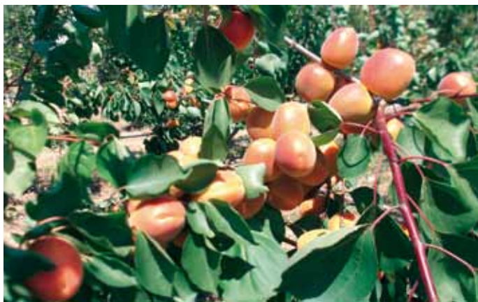
▲ Mogador* , varietà selezionata in Spagna, a basso fabbisogno in freddo.