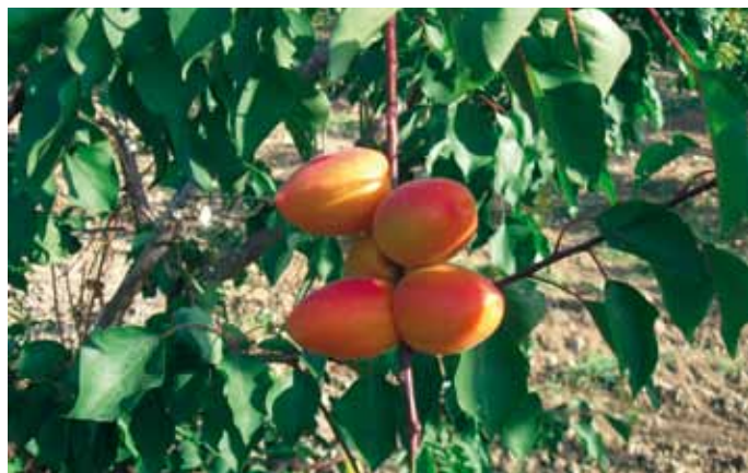
▲ Frutti di Wondercot* , con evidente presenza di umbone.